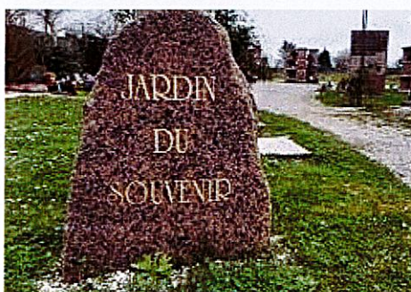
Exemple de stèle